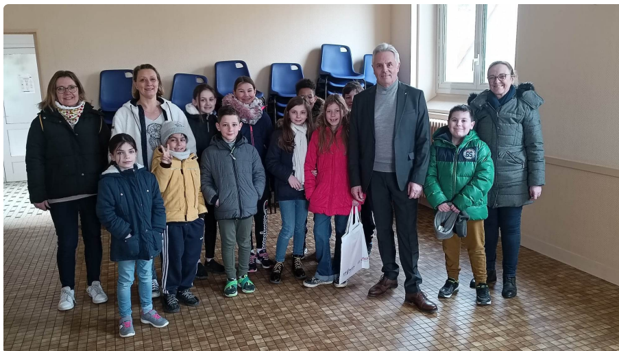
Le 19 mars, Commémoration du 19 mars 1962 au Monument aux morts.