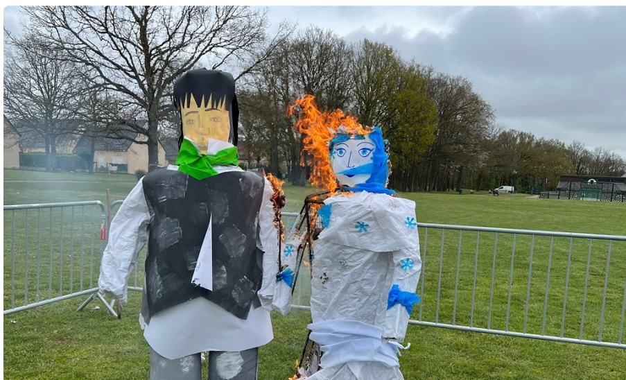
Adieu Monsieur et Madame HIVER

Chers abonnés(es), Chers Pierrotins et chères Pierrotines, l'Hiver est derrière nous, place au Printemps !